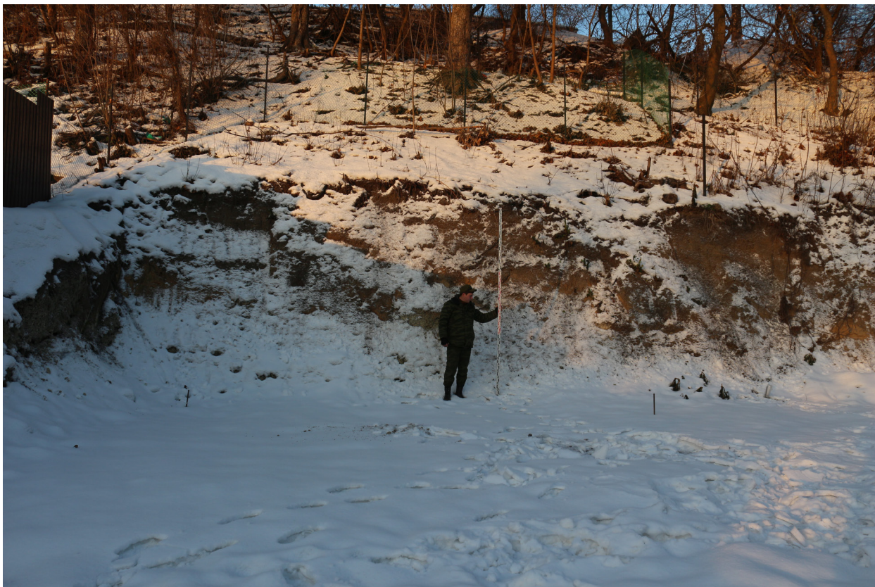
Рис. 16. Брянская область, г. Брянск. Проведение археологического обследования участка с кадастровым номером 32:28:0031707:157 по ул. Калинина. Общий вид на срезанный склон. Вид с востока-юго-востока.