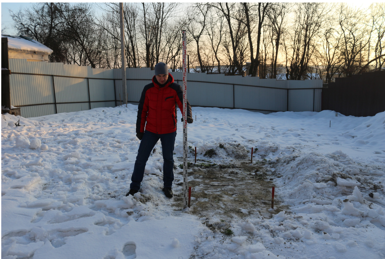
Рис. 26. Брянская область, г. Брянск. Проведение археологического обследования участка с кадастровым номером 32:28:0031707:157 по ул. Калинина. Шурф 1. Общий вид на шурф с разбивкой поверхности после расчистки от снега. Вид с запада.