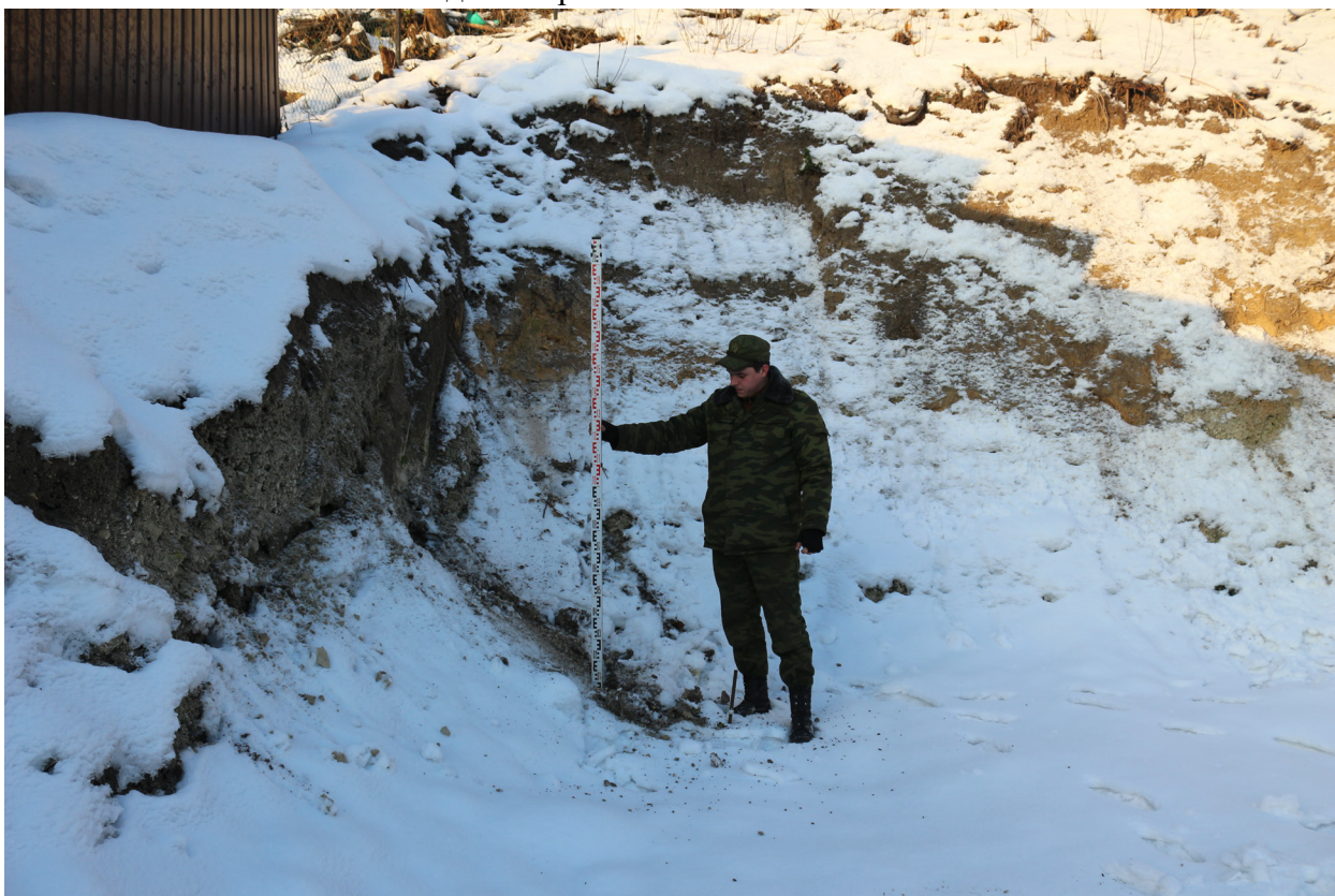
Рис. 45. Брянская область, г. Брянск. Проведение археологического обследования участка с кадастровым номером 32:28:0031707:157 по ул. Калинина. Зачистка 1. Общий вид на местоположение зачистки. Вид с востока.