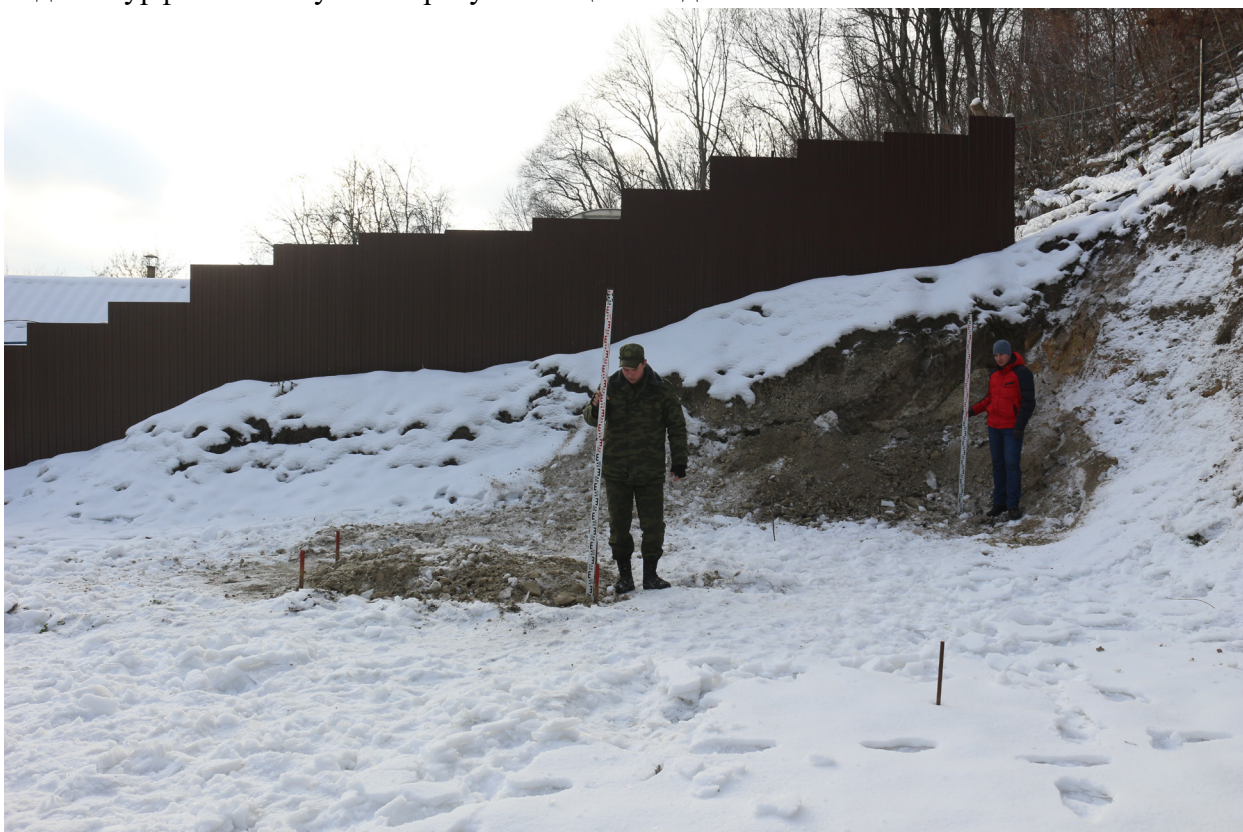
Рис. 43. Брянская область, г. Брянск. Проведение археологического обследования участка с кадастровым номером 32:28:0031707:157 по ул. Калинина. Шурф 1. Зачистка 1. Общий вид на шурф и зачистку после рекультивации. Вид с севера.