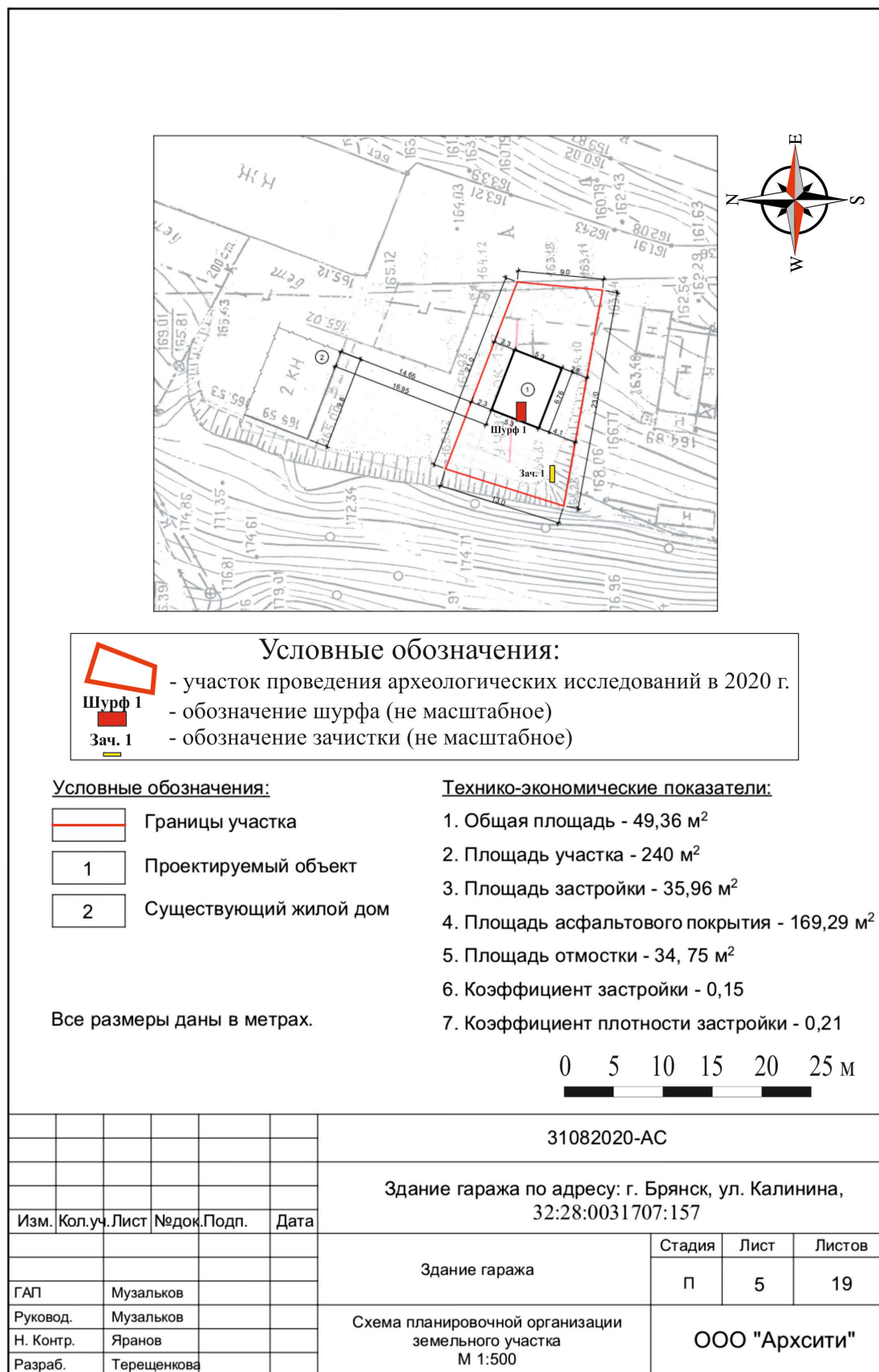
Рис. 9. Брянская область, г. Брянск. Проведение археологического обследования участка с кадастровым номером 32:28:0031707:157 по ул. Калинина. Обозначение шурфа и зачистки на плане участка, предоставленном заказчиком.