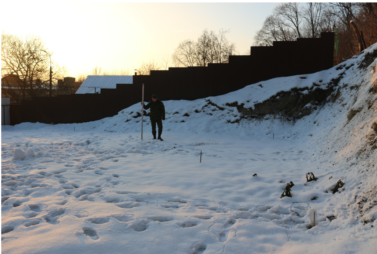
Рис. 18. Брянская область, г. Брянск. Проведение археологического обследования участка с кадастровым номером 32:28:0031707:157 по ул. Калинина. Общий вид на месторасположение шурфа 1. Вид с север-северо-запада.