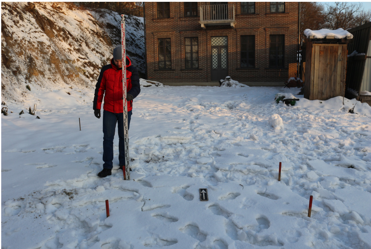
Рис. 20. Брянская область, г. Брянск. Проведение археологического обследования участка с кадастровым номером 32:28:0031707:157 по ул. Калинина. Шурф 1. Общий вид на шурф с разбивкой поверхности. Вид с юга.