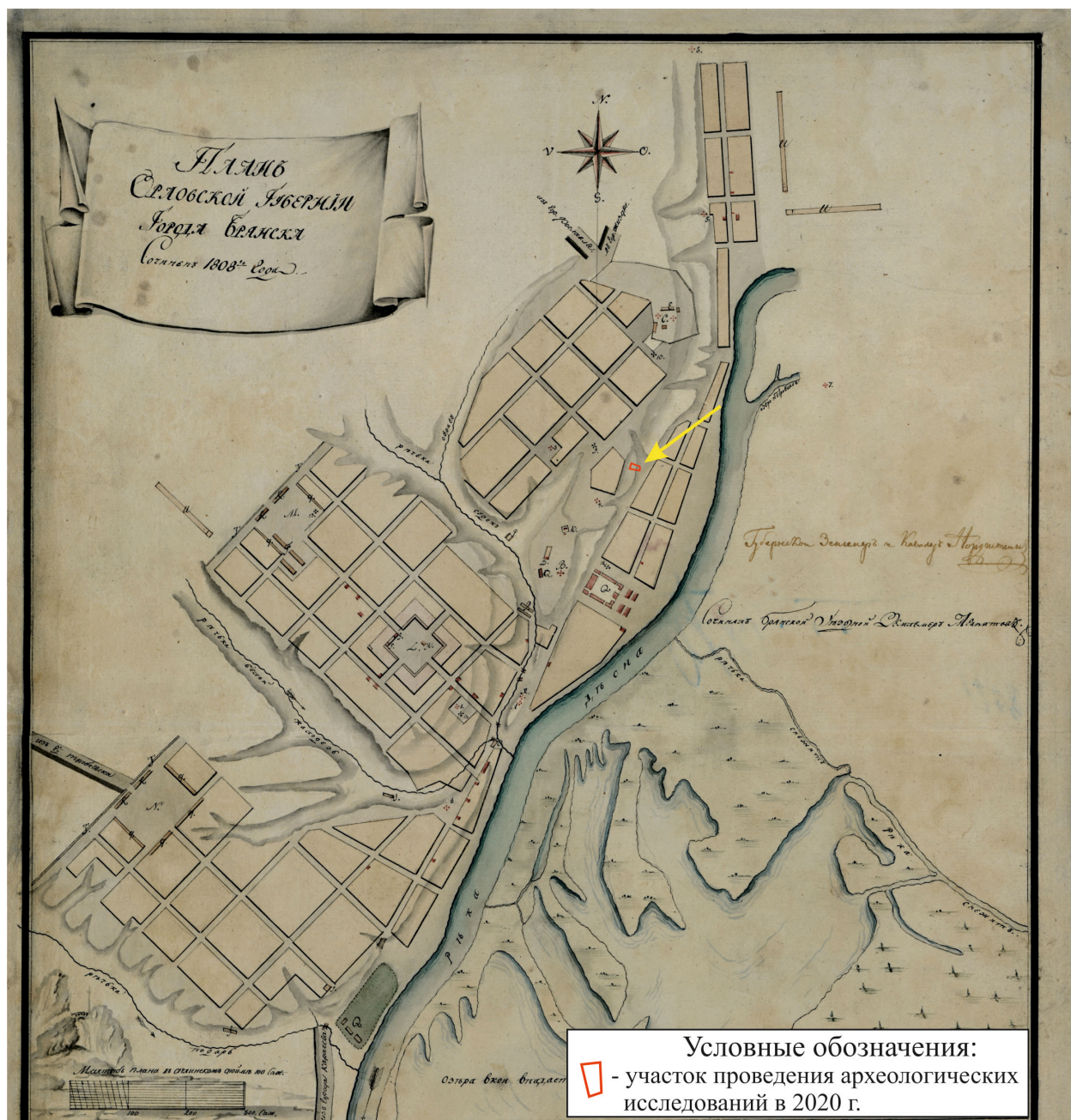
Рис. 3. Брянская область, г. Брянск. Проведение археологического обследования участка с кадастровым номером 32:28:0031707:157 по ул. Калинина. Участок проведения археологических исследований 2020 г. на плане города Брянска 1808 года. Карта размещена в свободном доступе в сети интернет.