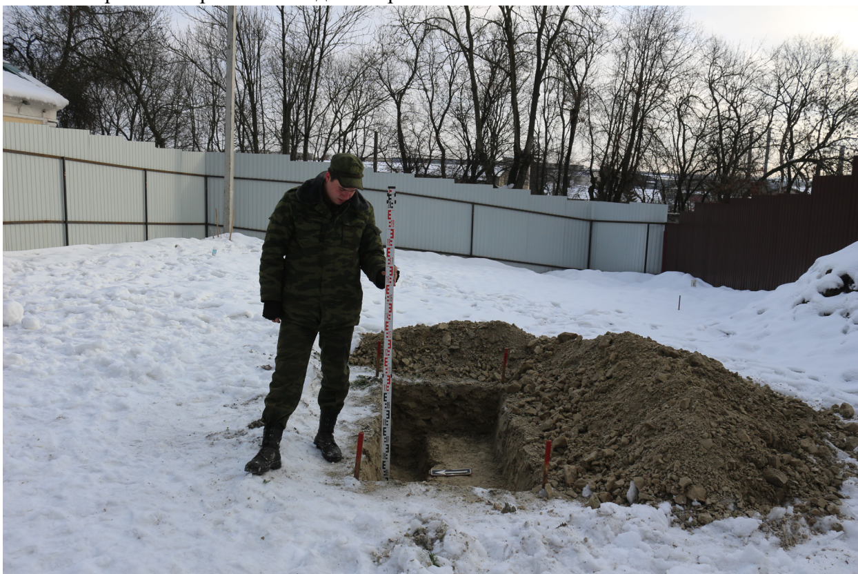
Рис. 39. Брянская область, г. Брянск. Проведение археологического обследования участка с кадастровым номером 32:28:0031707:157 по ул. Калинина. Шурф 1. Общий вид на шурф после контрольной прокопки. Вид с запада.