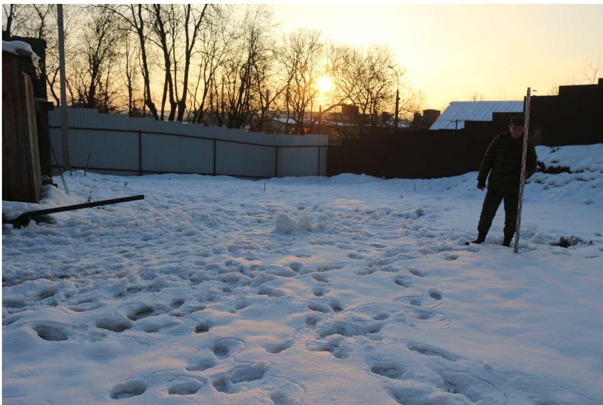
Рис. 14. Брянская область, г. Брянск. Проведение археологического обследования участка с кадастровым номером 32:28:0031707:157 по ул. Калинина. Общий вид на участок. Вид с северо-запада. Точка фотофиксации №3.