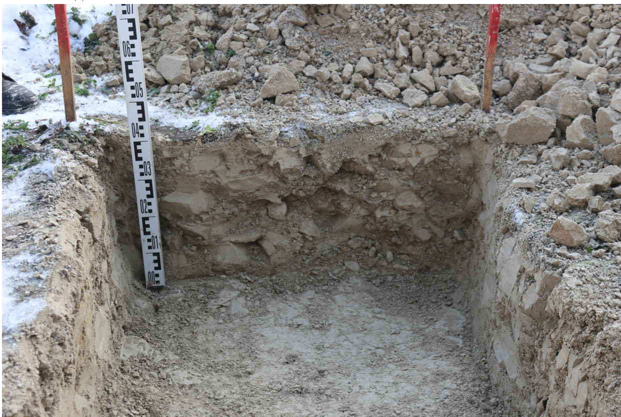
Рис. 29. Брянская область, г. Брянск. Проведение археологического обследования участка с кадастровым номером 32:28:0031707:157 по ул. Калинина. Шурф 1. Профиль восточной стенки. Вид с запада.