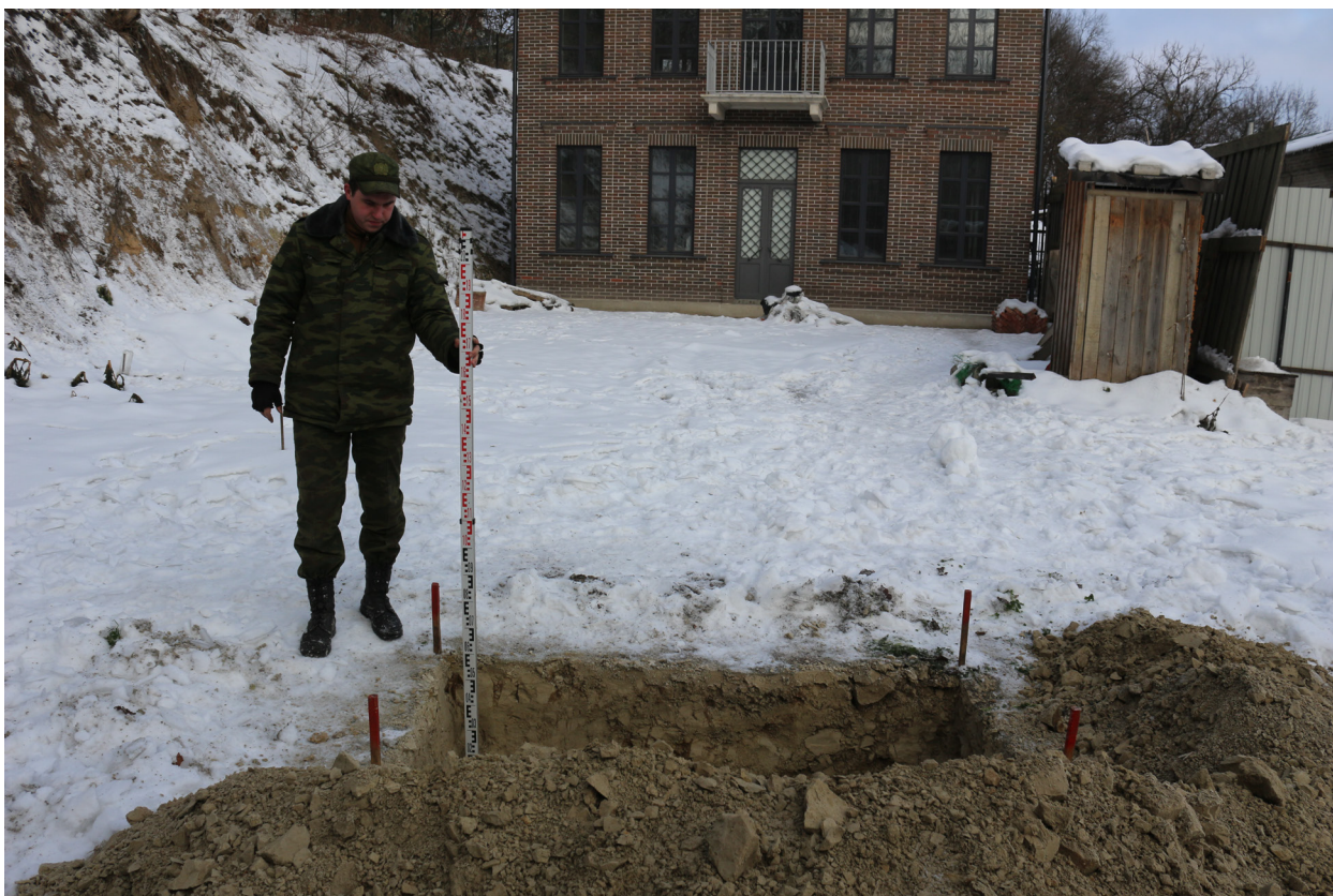
Рис. 36. Брянская область, г. Брянск. Проведение археологического обследования участка с кадастровым номером 32:28:0031707:157 по ул. Калинина. Шурф 1. Общий вид на шурф после контрольной прокопки. Вид с юга.