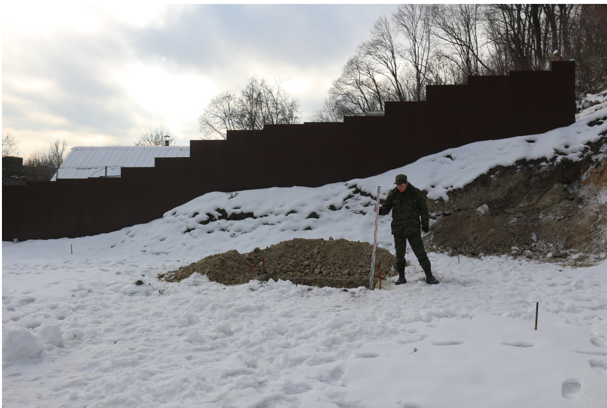
Рис. 38. Брянская область, г. Брянск. Проведение археологического обследования участка с кадастровым номером 32:28:0031707:157 по ул. Калинина. Шурф 1. Общий вид на шурф после контрольной прокопки. Вид с севера.