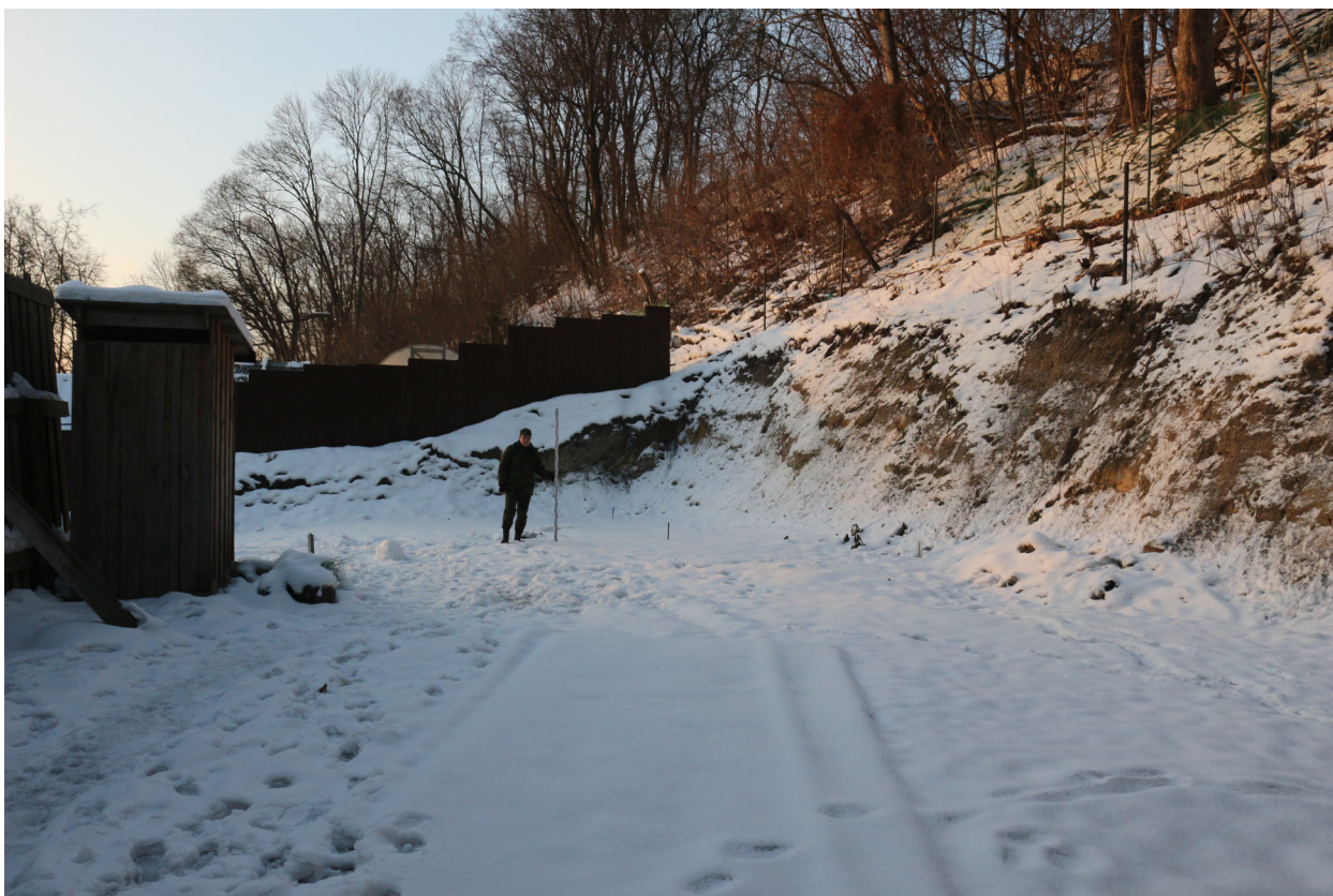
Рис. 12. Брянская область, г. Брянск. Проведение археологического обследования участка с кадастровым номером 32:28:0031707:157 по ул. Калинина. Общий вид на участок. Вид с север-северо-востока. Точка фотофиксации №1.