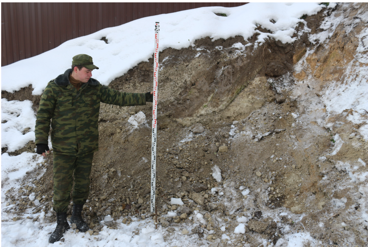
Рис. 49. Брянская область, г. Брянск. Проведение археологического обследования участка с кадастровым номером 32:28:0031707:157 по ул. Калинина. Зачистка 1. Вид на зачистку после рекультивации. Вид с севера.