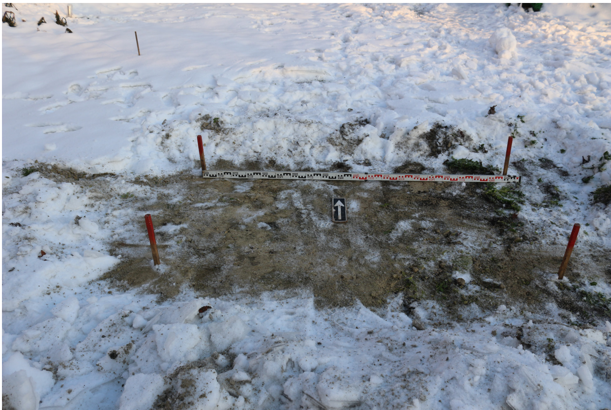
Рис. 22. Брянская область, г. Брянск. Проведение археологического обследования участка с кадастровым номером 32:28:0031707:157 по ул. Калинина. Шурф 1. Вид на поверхность шурфа с разбивкой поверхности после расчистки от снега. Вид сверху. Вид с юга.