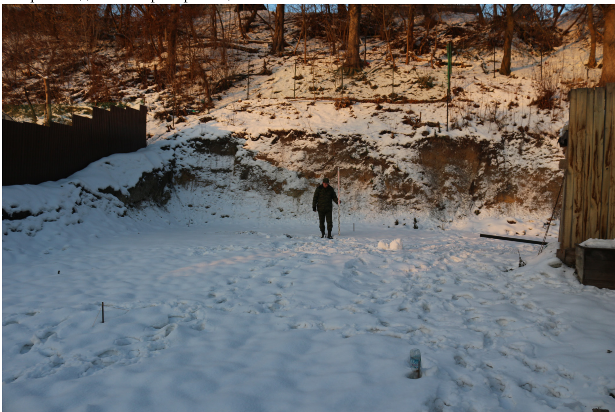
Рис. 15. Брянская область, г. Брянск. Проведение археологического обследования участка с кадастровым номером 32:28:0031707:157 по ул. Калинина. Общий вид на участок. Вид с востока. Точка фотофиксации №4.