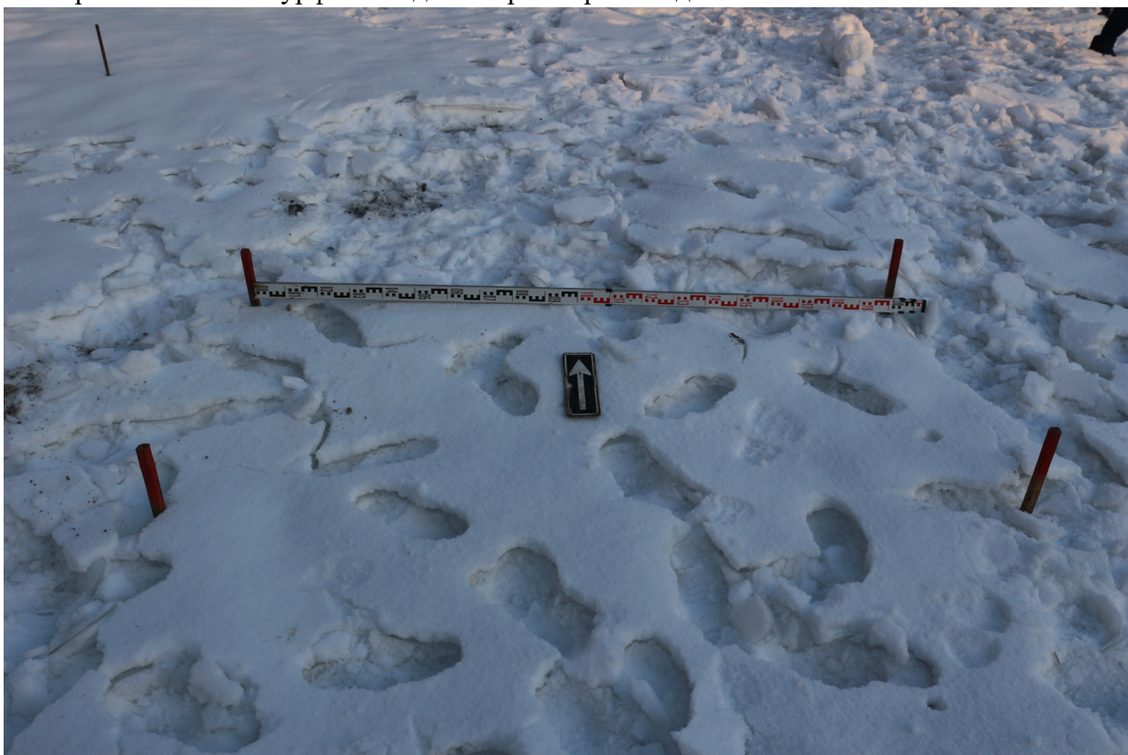
Рис. 19. Брянская область, г. Брянск. Проведение археологического обследования участка с кадастровым номером 32:28:0031707:157 по ул. Калинина. Общий вид на поверхность шурфа 1 с разбивкой поверхности. Вид сверху вид с юга.