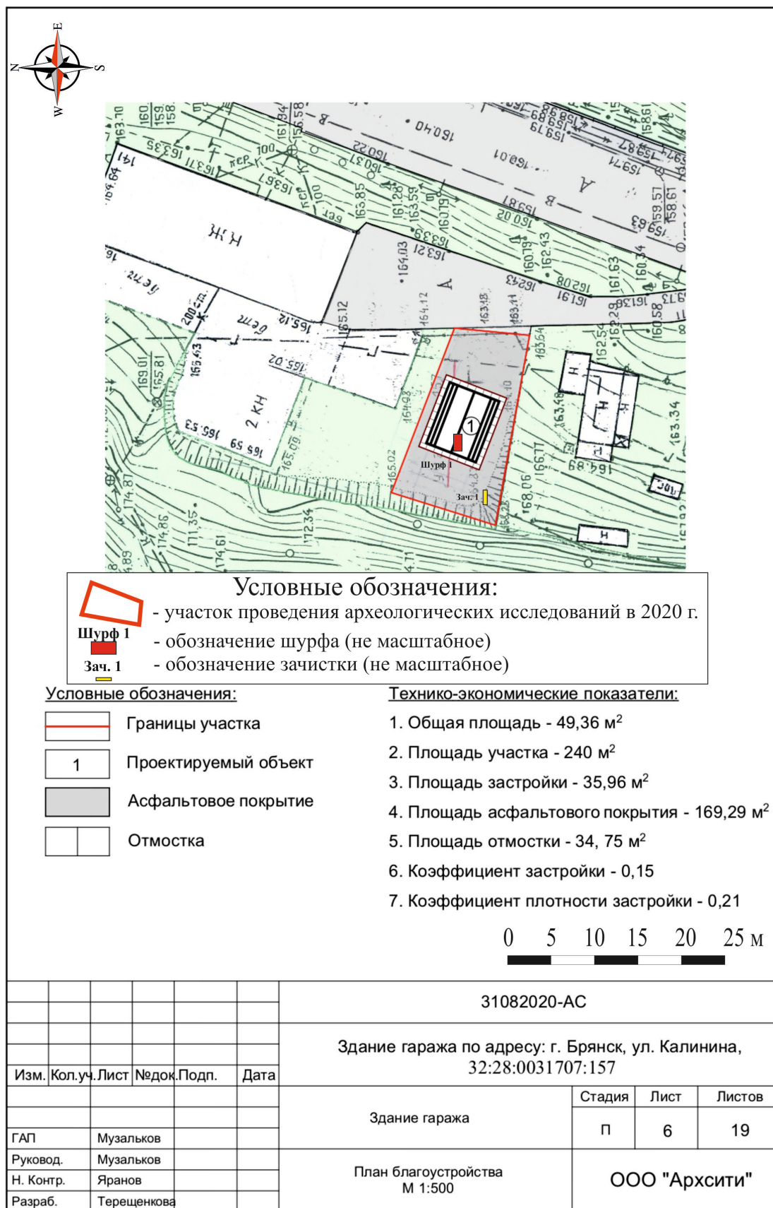
Рис. 11. Брянская область, г. Брянск. Проведение археологического обследования участка с кадастровым номером 32:28:0031707:157 по ул. Калинина. Обозначение шурфа и зачистки на плане участка, предоставленном заказчиком.