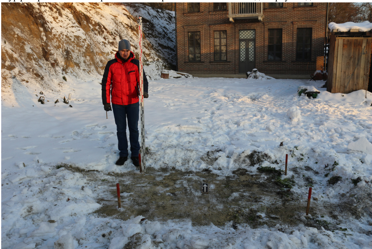
Рис. 23. Брянская область, г. Брянск. Проведение археологического обследования участка с кадастровым номером 32:28:0031707:157 по ул. Калинина. Шурф 1. Общий вид на шурф с разбивкой поверхности после расчистки от снега. Вид с юга.