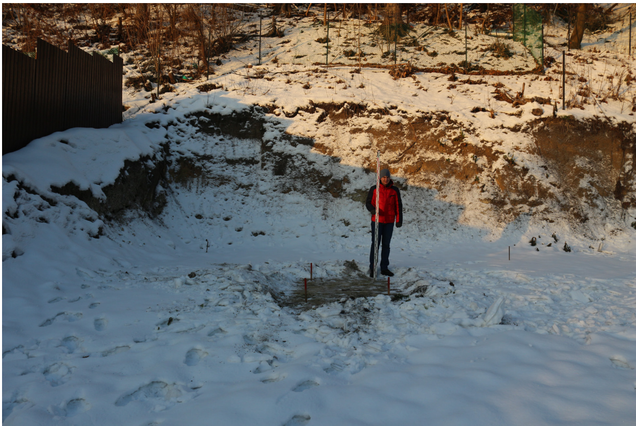
Рис. 24. Брянская область, г. Брянск. Проведение археологического обследования участка с кадастровым номером 32:28:0031707:157 по ул. Калинина. Шурф 1. Общий вид на шурф с разбивкой поверхности после расчистки от снега. Вид с востока.