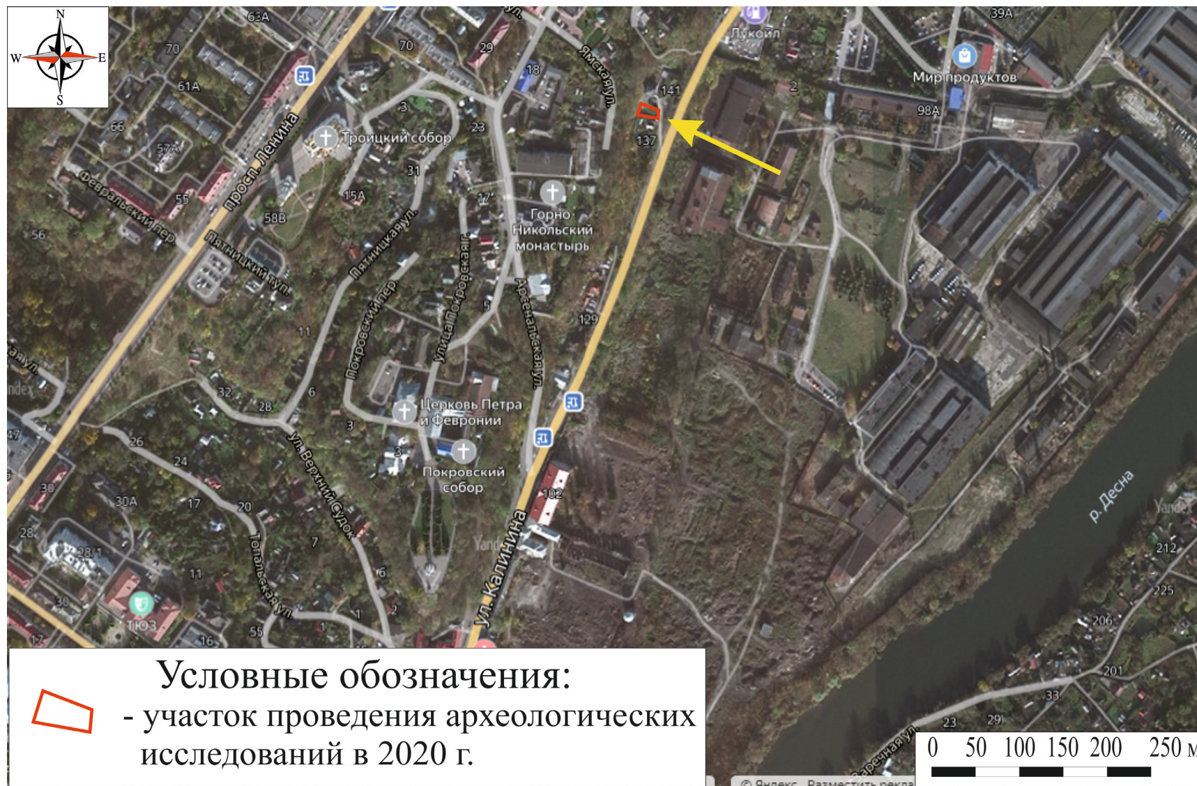
Рис. 7. Брянская область, г. Брянск. Проведение археологического обследования участка с кадастровым номером 32:28:0031707:157 по ул. Калинина. Участок проведения археологических исследований 2020 г. на фрагменте космического снимка местности (Яндекс Карты). Карта размещена в свободном доступе в сети интернет.