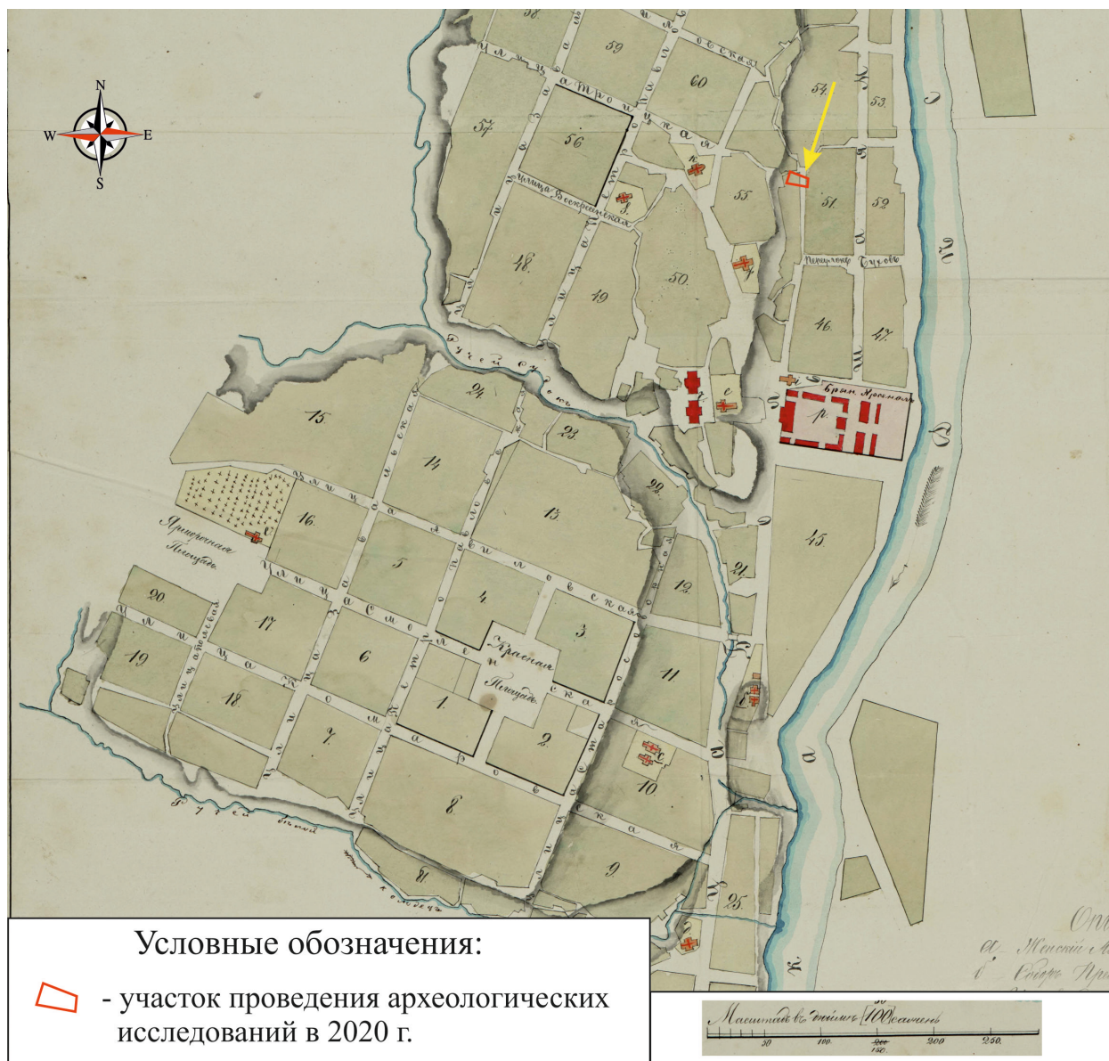
Рис. 4. Брянская область, г. Брянск. Проведение археологического обследования участка с кадастровым номером 32:28:0031707:157 по ул. Калинина. Участок проведения археологических исследований 2020 г. на фрагменте плана города Брянска 1872 года. Карта размещена в свободном доступе в сети интернет.