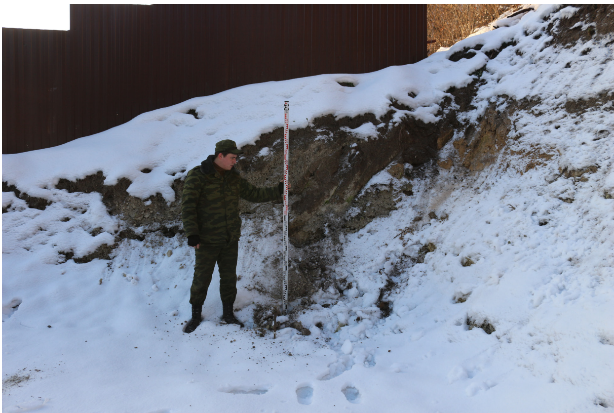
Рис. 44. Брянская область, г. Брянск. Проведение археологического обследования участка с кадастровым номером 32:28:0031707:157 по ул. Калинина. Зачистка 1. Общий вид на местоположение зачистки. Вид с севера.