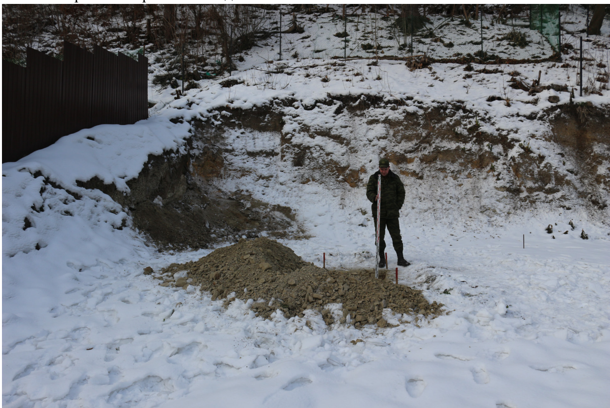
Рис. 37. Брянская область, г. Брянск. Проведение археологического обследования участка с кадастровым номером 32:28:0031707:157 по ул. Калинина. Шурф 1. Общий вид на шурф после контрольной прокопки. Вид с востока.