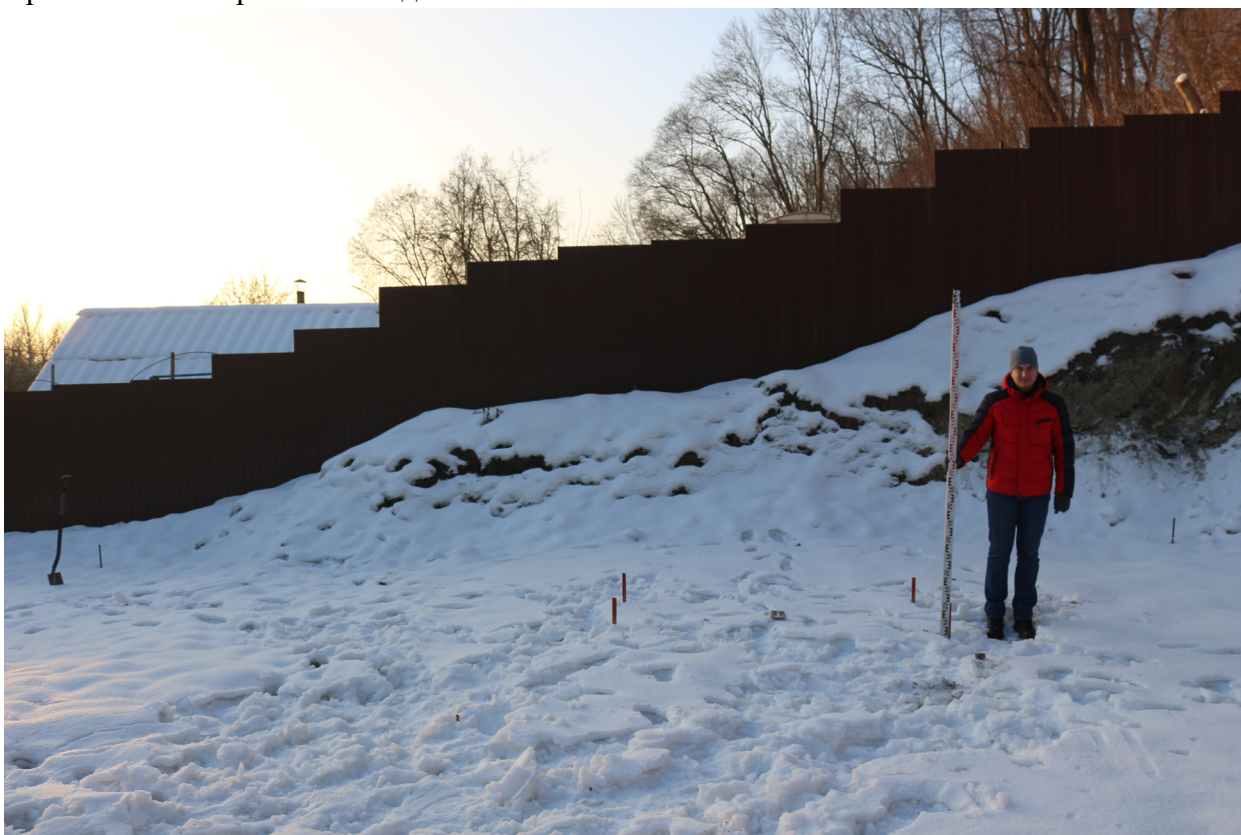
Рис. 21. Брянская область, г. Брянск. Проведение археологического обследования участка с кадастровым номером 32:28:0031707:157 по ул. Калинина. Шурф 1. Общий вид на шурф с разбивкой поверхности. Вид с севера.