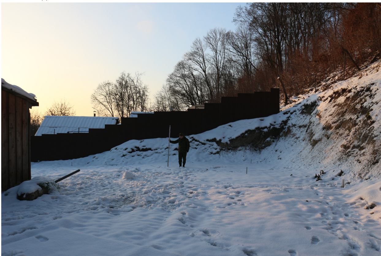
Рис. 17. Брянская область, г. Брянск. Проведение археологического обследования участка с кадастровым номером 32:28:0031707:157 по ул. Калинина. Общий вид на месторасположение шурфа 1. Вид с севера.