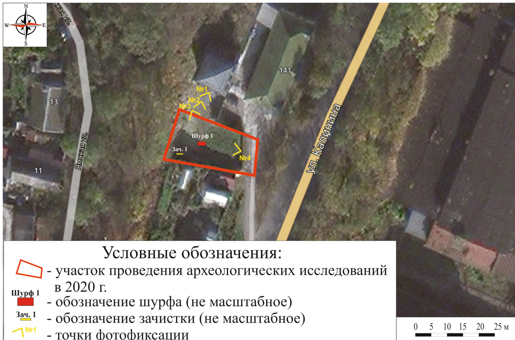
Рис. 8. Брянская область, г. Брянск. Проведение археологического обследования участка с кадастровым номером 32:28:0031707:157 по ул. Калинина. Границы участка проведения археологических исследований 2020 г. на фрагменте космического снимка местности (Яндекс Карты) с обозначением шурфа, зачистки и точек фотофиксации. Карта размещена в свободном доступе в сети интернет.