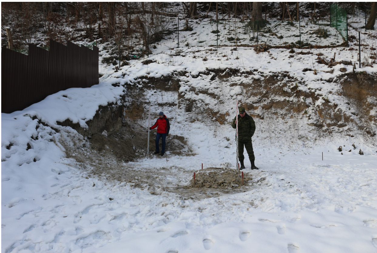
Рис. 42. Брянская область, г. Брянск. Проведение археологического обследования участка с кадастровым номером 32:28:0031707:157 по ул. Калинина. Шурф 1. Зачистка 1. Общий вид на шурф и зачистку после рекультивации. Вид с востока.