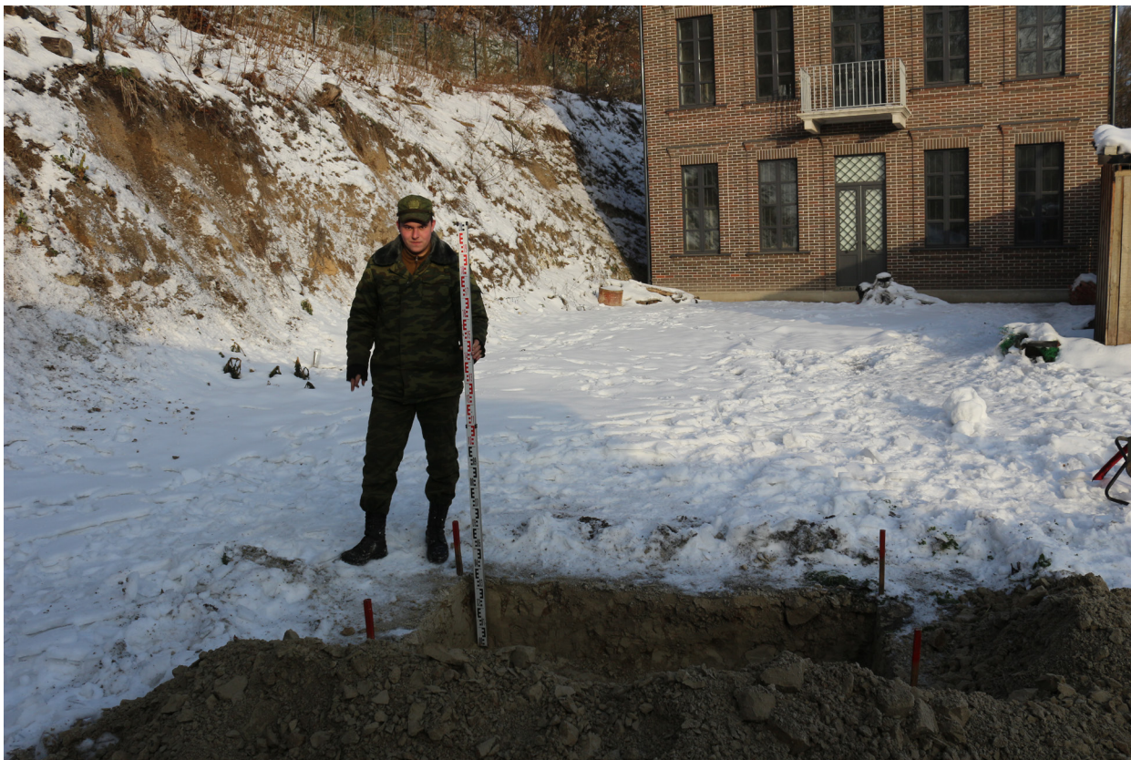
Рис. 32. Брянская область, г. Брянск. Проведение археологического обследования участка с кадастровым номером 32:28:0031707:157 по ул. Калинина. Шурф 1. Общий вид на шурф после выборки грунта. Вид с юга.