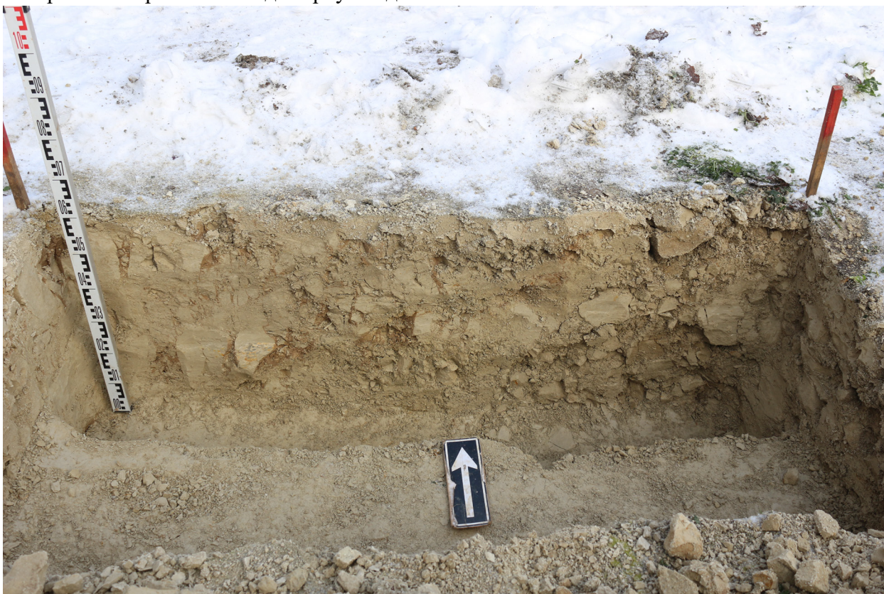
Рис. 35. Брянская область, г. Брянск. Проведение археологического обследования участка с кадастровым номером 32:28:0031707:157 по ул. Калинина. Шурф 1. Профиль северной стенки после контрольной прокопки. Вид с юга.