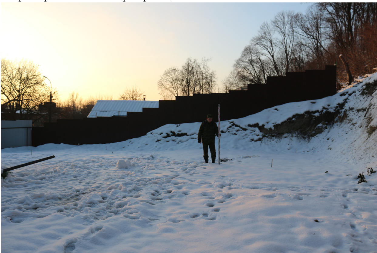
Рис. 13. Брянская область, г. Брянск. Проведение археологического обследования участка с кадастровым номером 32:28:0031707:157 по ул. Калинина. Общий вид на участок. Вид с севера. Точка фотофиксации №2.