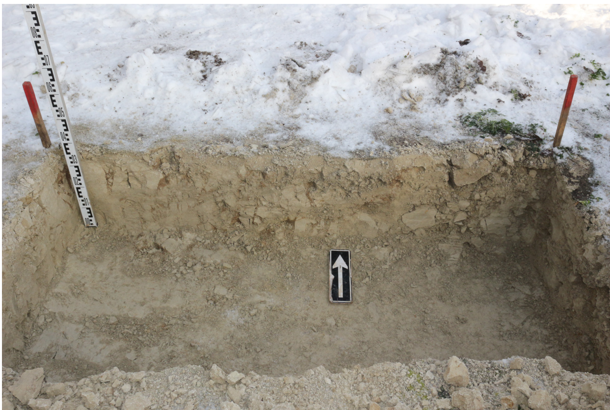
Рис. 28. Брянская область, г. Брянск. Проведение археологического обследования участка с кадастровым номером 32:28:0031707:157 по ул. Калинина. Шурф 1. Профиль северной стенки. Вид с юга.