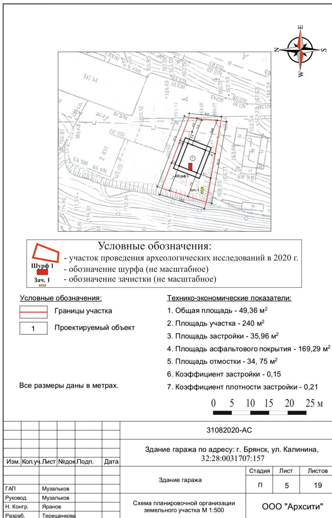
Рис. 10. Брянская область, г. Брянск. Проведение археологического обследования участка с кадастровым номером 32:28:0031707:157 по ул. Калинина. Обозначение шурфа и зачистки на плане участка, предоставленном заказчиком.