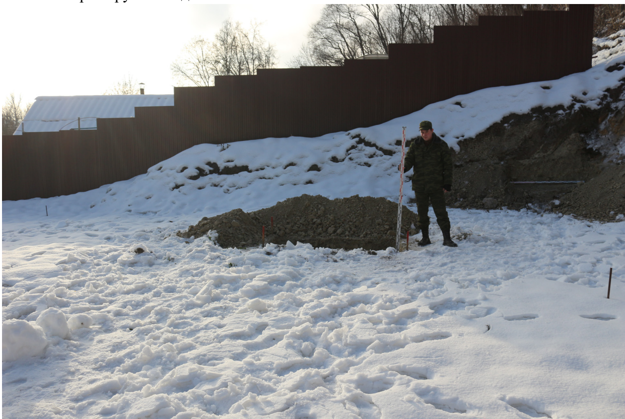
Рис. 33. Брянская область, г. Брянск. Проведение археологического обследования участка с кадастровым номером 32:28:0031707:157 по ул. Калинина. Шурф 1. Общий вид на шурф после выборки грунта. Вид с севера.