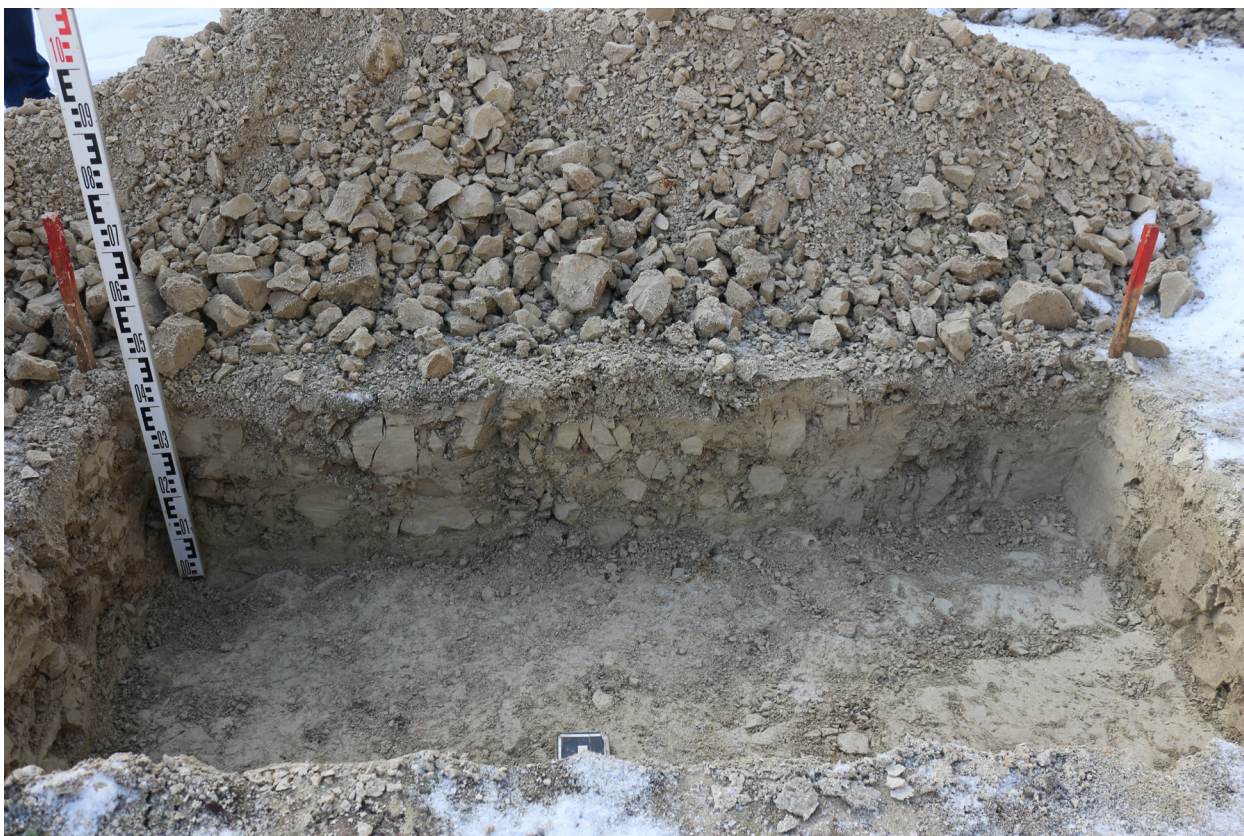
Рис. 30. Брянская область, г. Брянск. Проведение археологического обследования участка с кадастровым номером 32:28:0031707:157 по ул. Калинина. Шурф 1. Профиль южной стенки. Вид с севера.