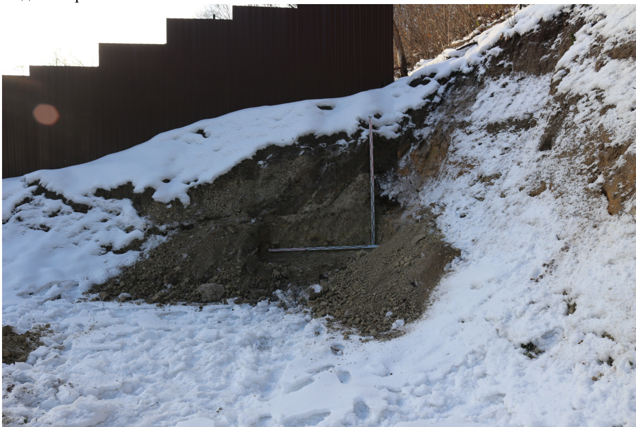
Рис. 48. Брянская область, г. Брянск. Проведение археологического обследования участка с кадастровым номером 32:28:0031707:157 по ул. Калинина. Зачистка 1. Общий вид на зачистку. Вид с севера.