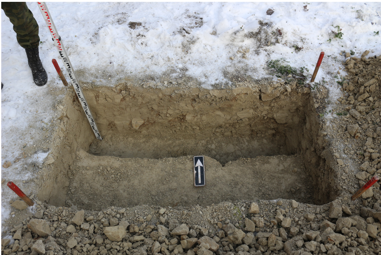
Рис. 34. Брянская область, г. Брянск. Проведение археологического обследования участка с кадастровым номером 32:28:0031707:157 по ул. Калинина. Шурф 1. Вид на шурф после контрольной прокопки. Вид сверху. Вид с юга.