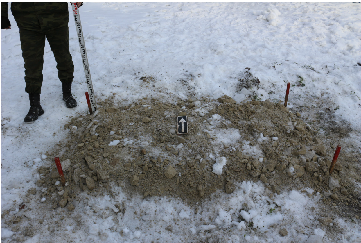
Рис. 40. Брянская область, г. Брянск. Проведение археологического обследования участка с кадастровым номером 32:28:0031707:157 по ул. Калинина. Шурф 1. Вид на шурф после рекультивации. Вид сверху. Вид с юга.