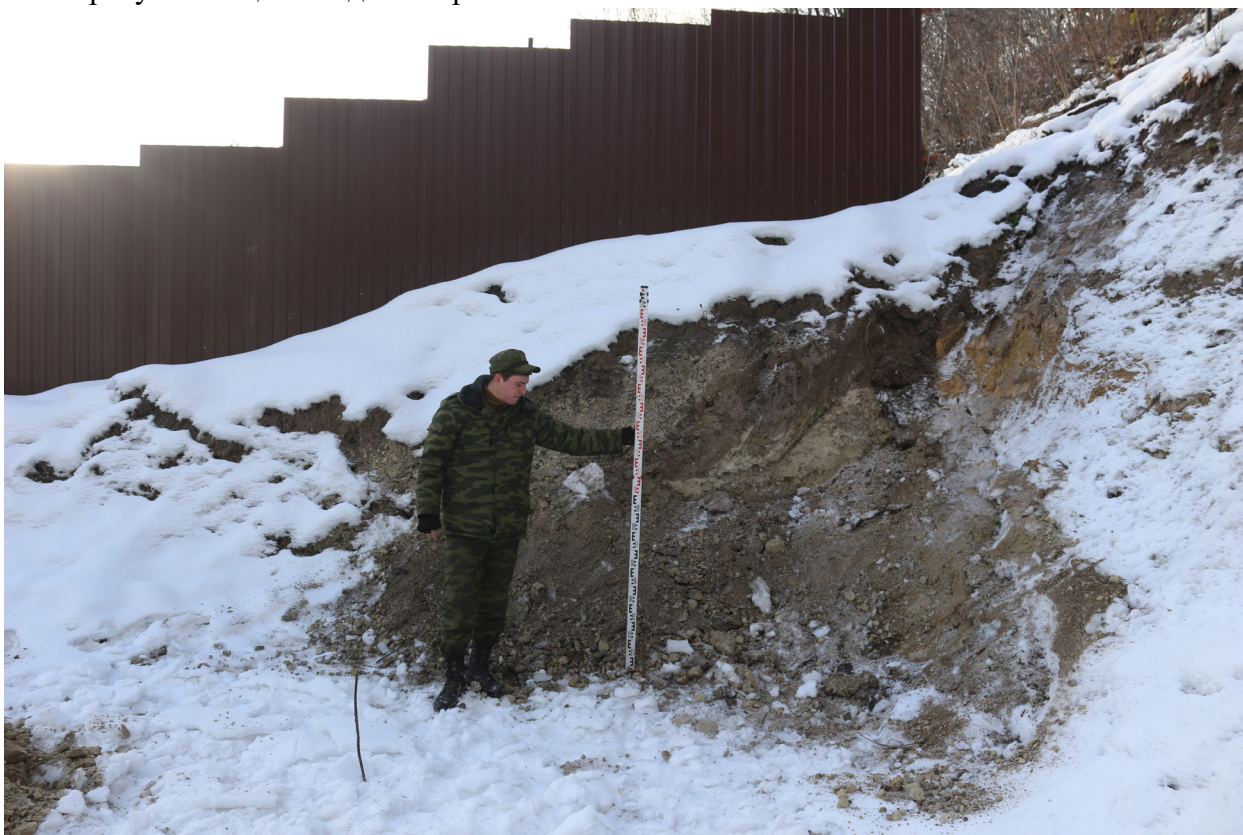
Рис. 50. Брянская область, г. Брянск. Проведение археологического обследования участка с кадастровым номером 32:28:0031707:157 по ул. Калинина. Зачистка 1. Общий вид на зачистку после рекультивации. Вид с севера.