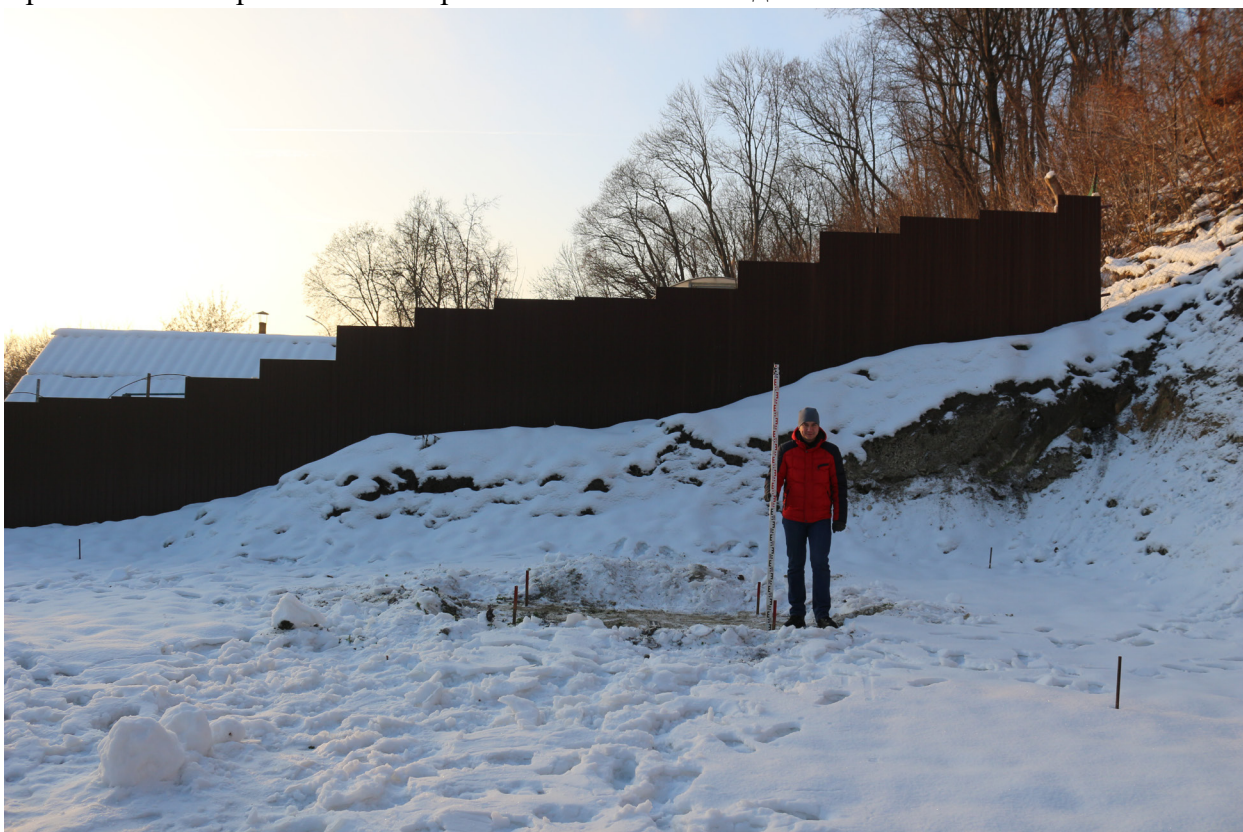
Рис. 25. Брянская область, г. Брянск. Проведение археологического обследования участка с кадастровым номером 32:28:0031707:157 по ул. Калинина. Шурф 1. Общий вид на шурф с разбивкой поверхности после расчистки от снега. Вид с севера.