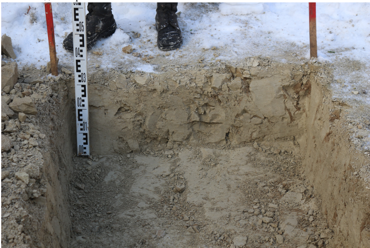
Рис. 31. Брянская область, г. Брянск. Проведение археологического обследования участка с кадастровым номером 32:28:0031707:157 по ул. Калинина. Шурф 1. Профиль западной стенки. Вид с востока.