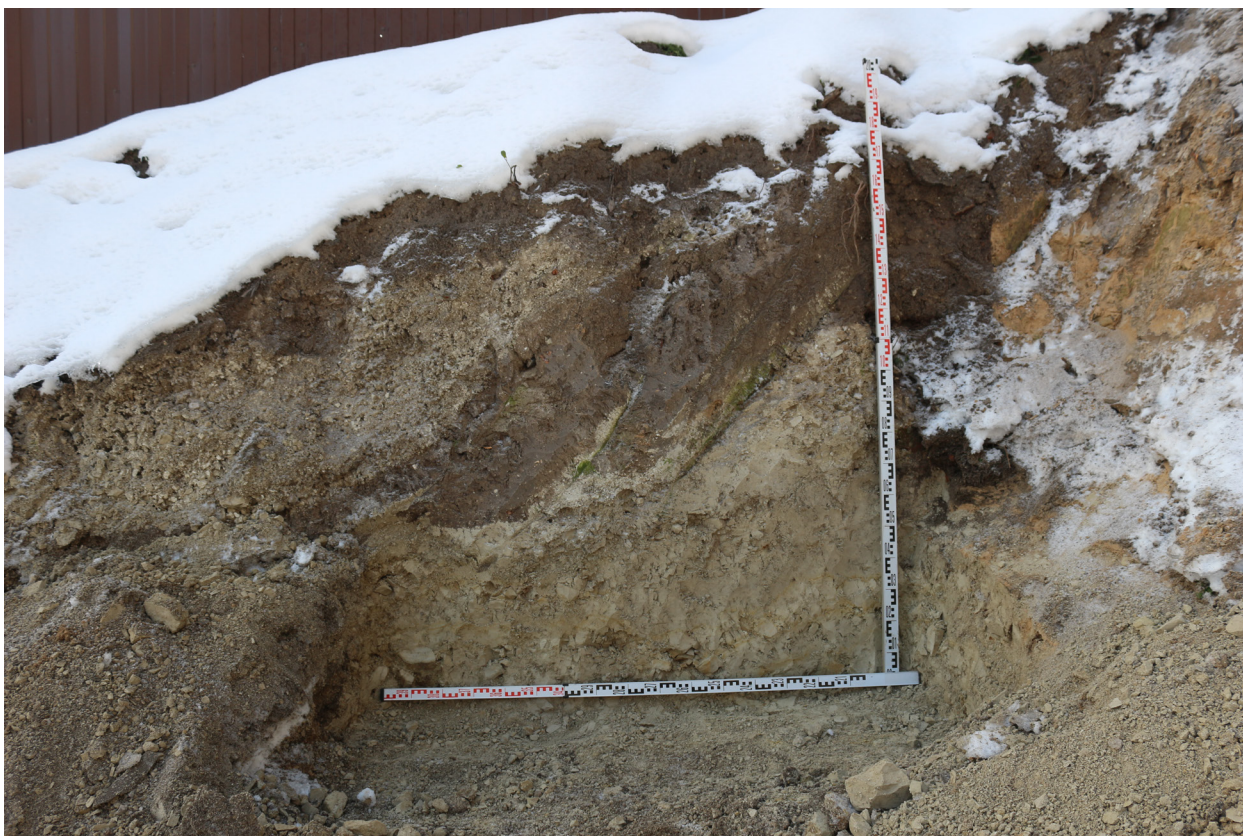
Рис. 47. Брянская область, г. Брянск. Проведение археологического обследования участка с кадастровым номером 32:28:0031707:157 по ул. Калинина. Зачистка 1. Профиль зачистки. Вид с севера.