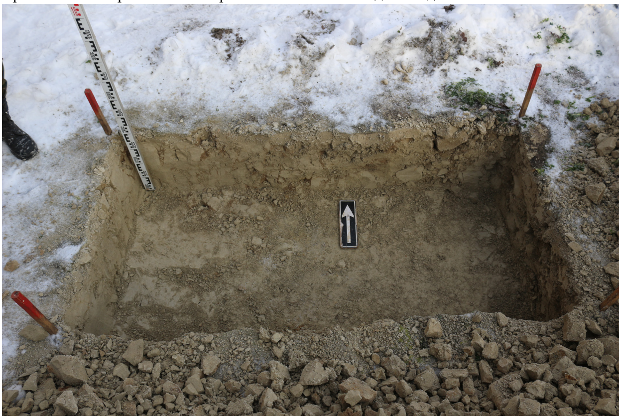
Рис. 27. Брянская область, г. Брянск. Проведение археологического обследования участка с кадастровым номером 32:28:0031707:157 по ул. Калинина. Шурф 1. Вид на шурф после выборки грунта. Вид сверху. Вид с юга.