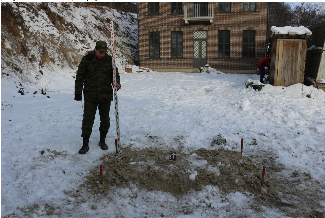
Рис. 41. Брянская область, г. Брянск. Проведение археологического обследования участка с кадастровым номером 32:28:0031707:157 по ул. Калинина. Шурф 1. Общий вид на шурф после рекультивации. Вид с юга.